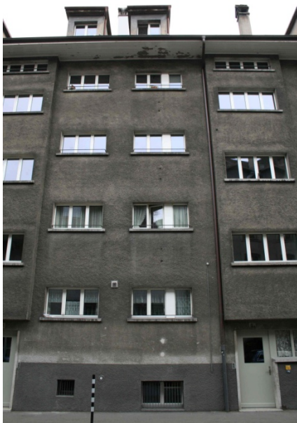
Abbildung 11 "Geschwärzte" Häuser

Als ich wieder auf der Aarstrasse bin, fallen mir die geschwärzten Häuser auf, die so gar nicht dem vorigen Bild des Quartiers entsprechen. Ihnen gegenüber hat sich auch das Angebot geändert.