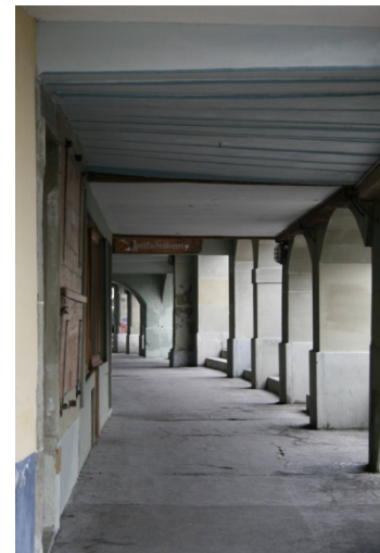
Abbildung 5 Lauben

Der Mühleplatz ist ein freundlicher Ort. Einige Handwerker arbeiten, eine Frau geht in den Matte-Laden einkaufen. Es sind nur wenige Menschen hier aber nicht zu sehen. Mitten durch den Mühleplatz fliesst der Mattenbach, der verleiht dem Platz ein merkwürdiges Bild.