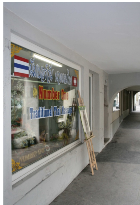
Abbildung 12 Numer One Traditional Thai Massage