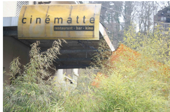
Abbildung 10 Kino: Cinématte

Interessant finde ich, dass hier mehr Menschen zu sehen sind, es ist Arbeitszeit und hier arbeitet man wohl in der Matte.