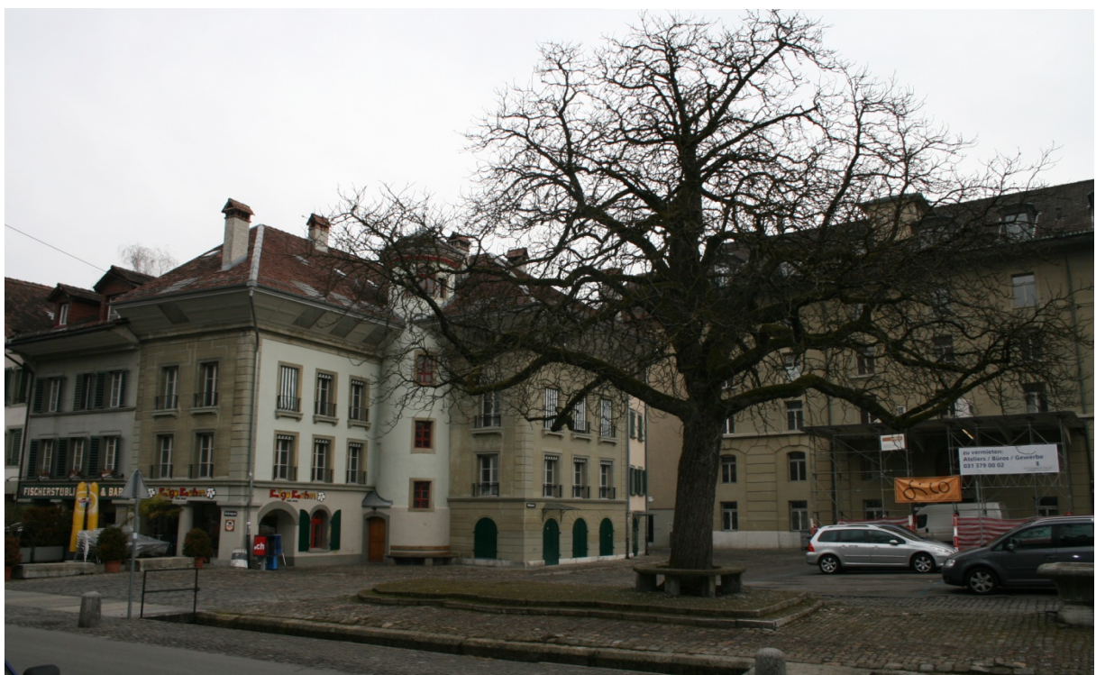
Abbildung 8 Mühleplatz