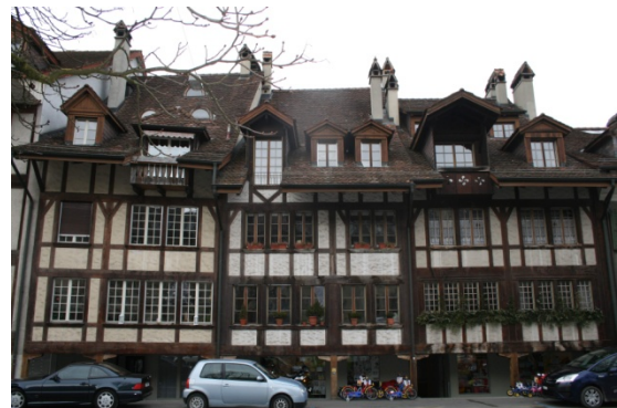
Abbildung 7 Rieghäuser

Wieder überquere ich die Strasse und gehe zum Schulhaus. Doch ein recht imposantes Schulhaus. Jetzt bemerke ich auch die alten Häuser, die mir unter den Lauben entgangen sind, welche zum speziellen Charakter des Quartiers beitragen.