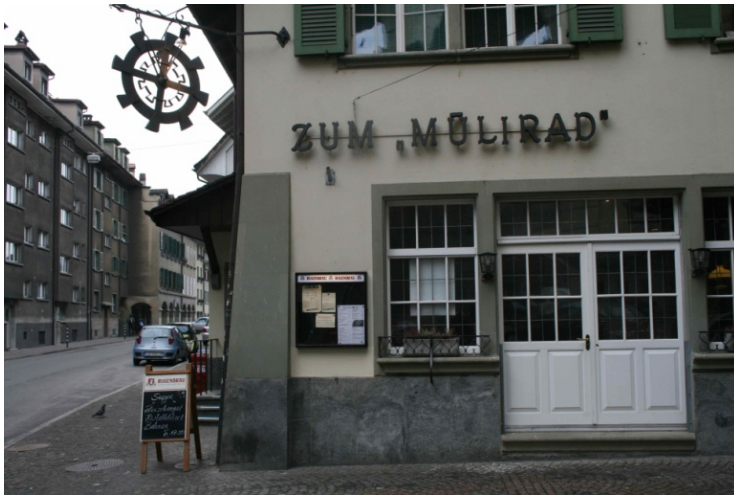
Abbildung 13 Zum Mülirad

Zum Abschluss meines Besuches in der Matte, trinke ich im Mülirad einen Kaffee. Das Mülirad sei eine der letzten „Mätteler-Stammtische“ und tatsächlich herrscht etwas Stammtischatmosphäre, wenn auch um die Uhrzeit fast keine Gäste an den hölzernen Tischen sitzen.