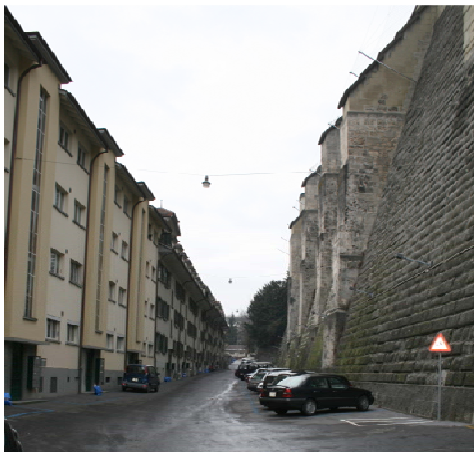
Abbildung 1 Badgasse

Bei der Münsterplattform steige ich durch die Fricktreppe hinunter in das Mattenquartier. Der Himmel ist bewölkt, alles wirkt deshalb ein wenig düster. In der Fricktreppe brennen Lampen. Durch die Fricktreppe gelange ich in die Badgasse, hier war früher das Armenviertel des Quartiers. Auf meiner linken Seite ragen hoch die Mauern der Münsterplattform auf. Das Gefälle bestand schon vor der Bebauung durch den Menschen. Auf der rechten Seite steht eine Häuserreihe, die in einem seltsamen Kontrast zur Mauer der Münsterplattform steht. Um nicht die Treppe zur Münsterplattform nehmen zu müssen, hat man einen Lift gebaut. Die Stahlkonstruktion wirkt ein wenig bedrohlich. Will man den Lift benutzen, muss man 1.20 Fr. zahlen, darauf weist der Liftwart freundlich hin.