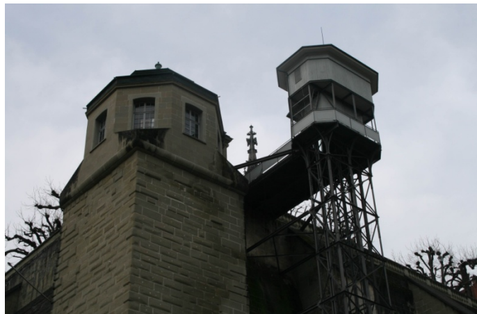
Abbildung 2 Mattenlift

Beim Verlassen der Badgasse fallen mir zwei schön gebaute Häuser auf, die rechts und links, den Ein- oder Ausgang in die Gasse flankieren. Die Stimmung wirkt sofort leichter und aufgehellter.