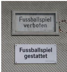
Abbildung 6 Vorschriften Pausenplatz

Unter den Lauben durch, erreiche ich die alte Turnhalle, vor ihr ein Pausenplatz, der reichlich mit Vorschriften belegt ist.