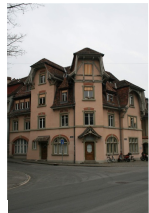
Abbildung 3 Eckhaus: Badgasse/ Aarstrasse

Jetzt fällt mir der Verkehr auf, sehr viele Autos fahren auf der doch recht engen Strasse durch das Quartier. Es ist etwa 13:30 Uhr, der Mittag ist vorbei und Viele fahren wieder zur Arbeit, doch Viele scheinen nicht im Quartier zu arbeiten, sondern sie benutzen die Aarstrasse um die Innenstadt zu umfahren. Als ein Lieferwagen die Strasse blockiert, steht der Verkehr für einige Minuten still, kurz ist wieder Ruhe.