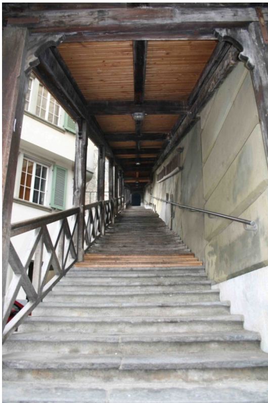
Abbildung 14 Nydeggtreppe

Zum Abschluss meines Besuches in der Matte, trinke ich im Mülirad einen Kaffee. Das Mülirad sei eine der letzten „Mätteler-Stammtische“ und tatsächlich herrscht etwas Stammtischatmosphäre, wenn auch um die Uhrzeit fast keine Gäste an den hölzernen Tischen sitzen.