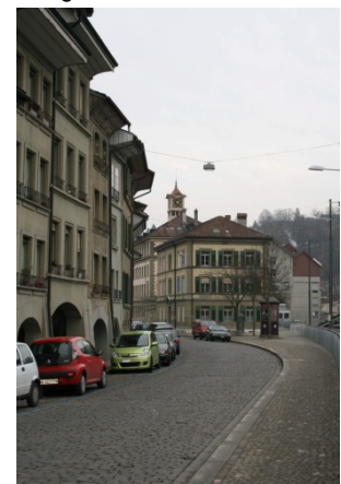
Abbildung 4 Aarstrasse